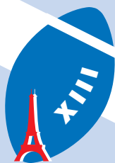
Table Ovale Paris Ile-de-France